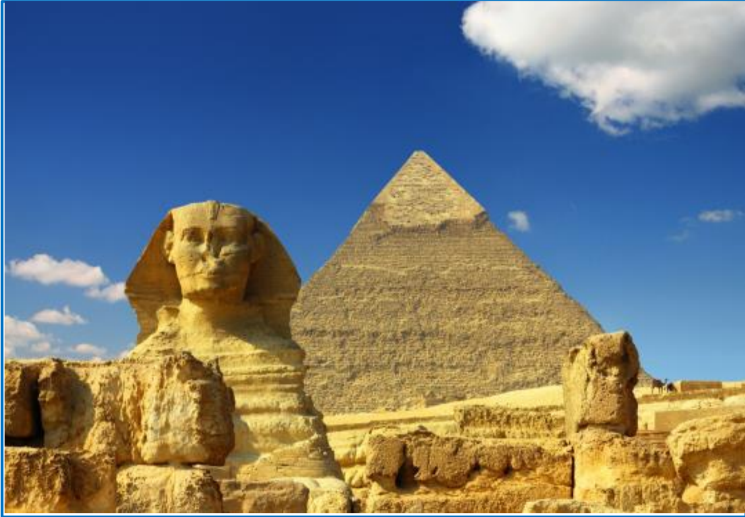
大ピラミッドとスフィンクス